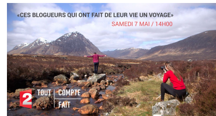
REPORTAGE FRANCE 2

Cliquez sur les images pour lancer les vidéos